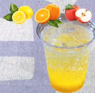
果肉入りドリンク 500 円