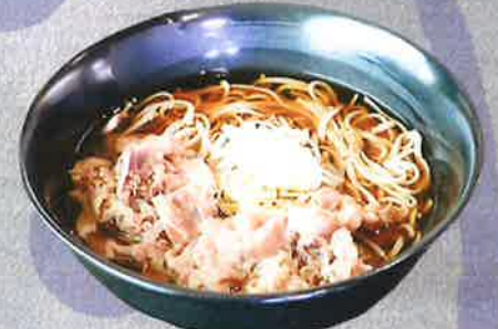
肉そば 1300 円