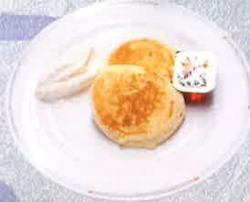
ホットケーキメープル 700 円