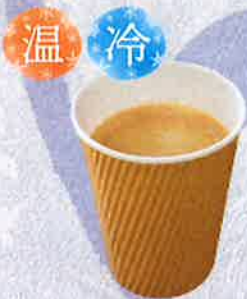
コーヒー 400 円