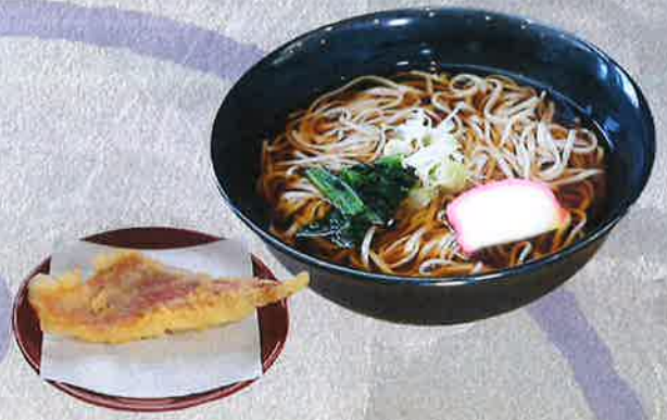
金目天そば 1500 円