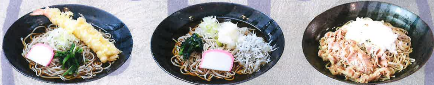
海老天そば 1250 円 しらすおろしそば 1300 円 おろし肉そば 1400 円