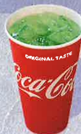
メロンソーダ 350 円