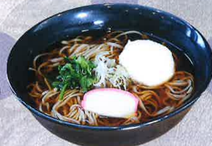
とろろそば 1250 円