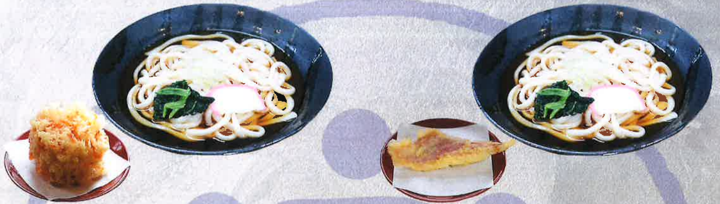
桜エビかき揚げうどん 1500 円