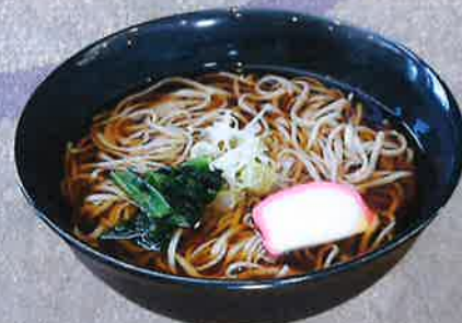
かけそば 900 円