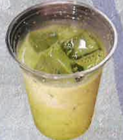
抹茶ミルク 500 円