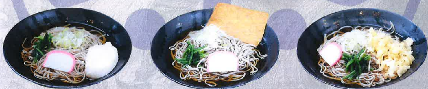
とろろそば 1250 円