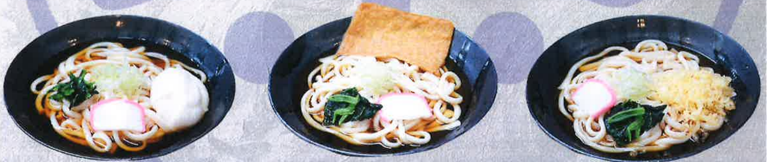
とろろうどん 1250 円