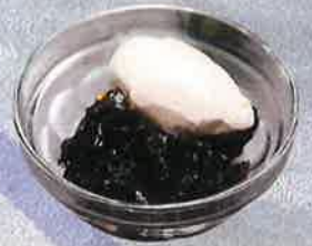
コーヒーゼリー 500 円