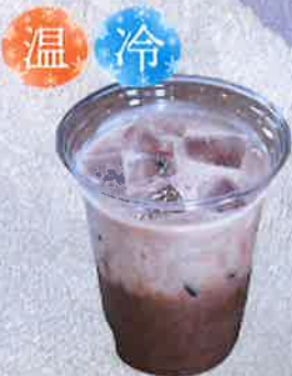
ココア 450 円