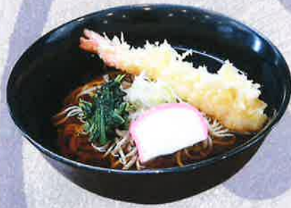
海老天そば 1250 円