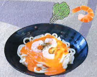
各種 クリームうどん 1250円