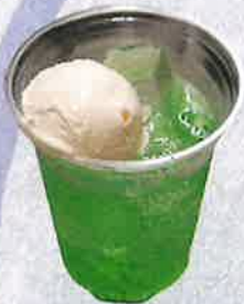
各種フロート 650 円