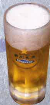
静岡麦酒 700 円