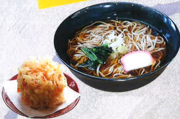
桜エビかきあげそば 1500 円