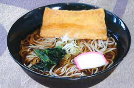
きつねそば 1050 円