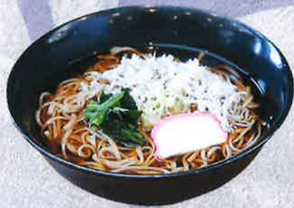
しらすそば 1250 円