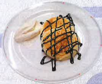
ホットケーキチョコ 700 円