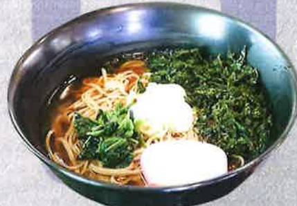
地海苔そば 1350 円