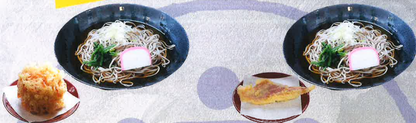
桜エビかき揚げそば 1500 円