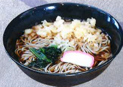
たぬきそば 1000 円