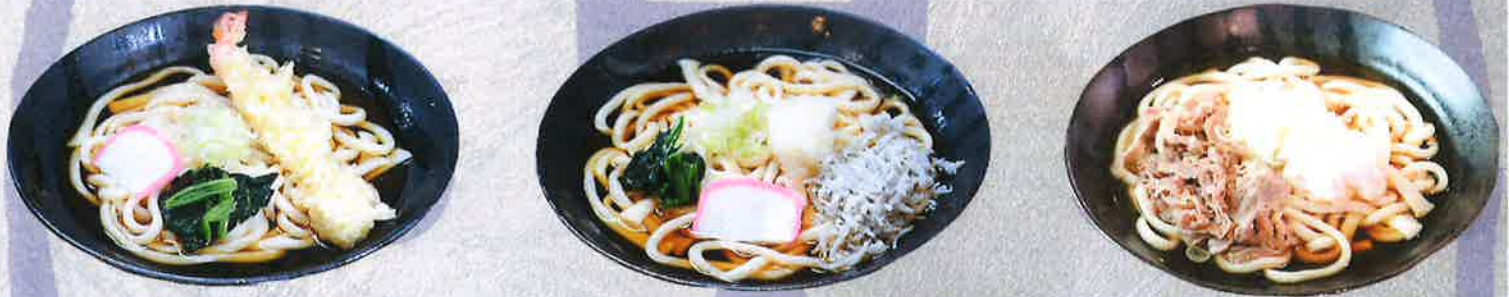
海老天うどん 1250 円