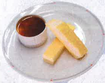
プリンセット 800 円