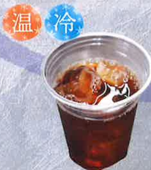
紅茶 400 円