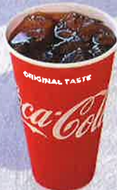
コーラ 350 円