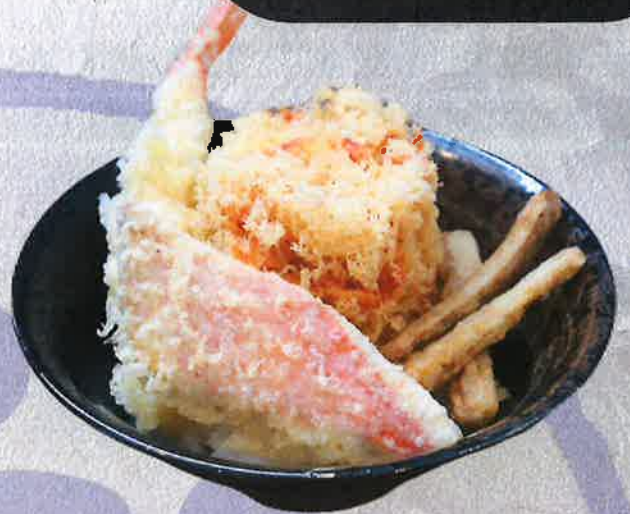
しらす桜エビ 2色丼 1500 円