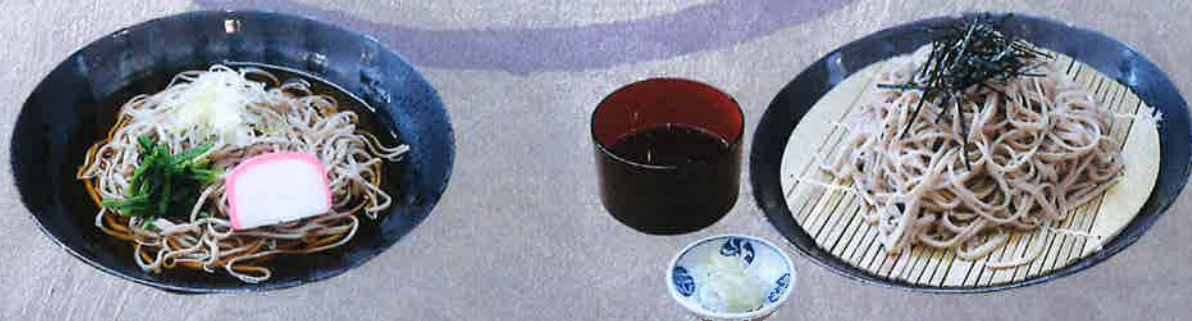
かけそば 900 円