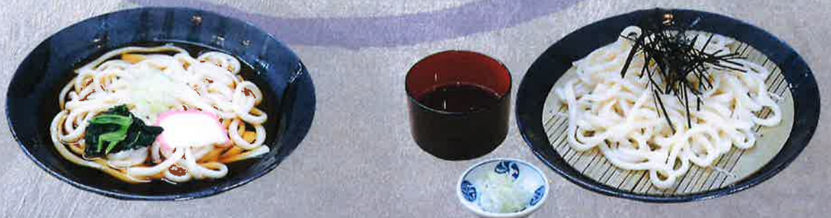
かけうどん 900 円