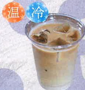
カフェラテ 500 円