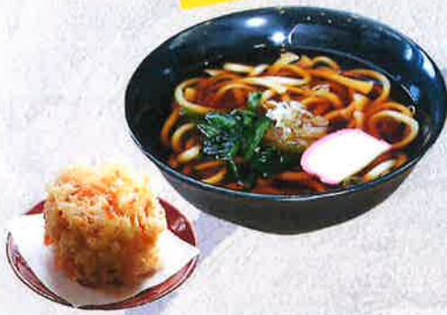
桜エビかき揚げうどん 1500円